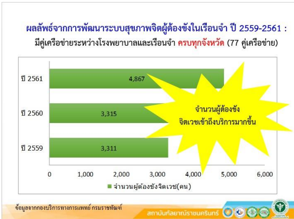
ภาพที่ 1 แสดงจำนวนผู้ต้องขังจิตเวช ปี 2559-2561

ส่วนผลการดำเนินงานพัฒนาระบบบริการจิตเวชในเครือข่ายราชทัณฑ์ พบว่า ผู้ปฏิบัติงานในเรือนจำ/ทัณฑสถานทั่วประเทศ เข้ารับการอบรมพัฒนาศักยภาพในการดูแลผู้ต้องขังที่มีปัญหา สุขภาพจิตและจิตเวช จำนวน 107 คน ซึ่งผลจากการพัฒนาศักยภาพนั้น ส่งผลให้มีระบบการดูแลผู้ต้องขังที่มี ประสิทธิภาพมากยิ่งขึ้น โดยสามารถคัดกรองและนำผู้ต้องขังกลุ่มที่มีอาการผิดปกติทางจิตเข้าสู่กระบวนการ บำบัดรักษาเพิ่มมากยิ่งขึ้น ซึ่งสอดคล้องกับจำนวนผู้ต้องขังจิตเวชจากกองบริการทางการแพทย์ กรมราชทัณฑ์ ซึ่งมีจำนวนเพิ่มมากขึ้น (ดังภาพที่ 1 แสดงจำนวนผู้ต้องขังจิตเวช ปี 2559-2561) นอกจากนี้จากการพัฒนา ระบบบริการจิตเวชในเรือนจำร่วมกับหน่วยบริการจิตเวชในพื้นที่ สามารถพัฒนาระบบการดูแลผู้ต้องขัง โดย ผ่านการประชุมทางไกล (Tele Conference หรือ Tele Psychiatry) ซึ่งเป็นการเพิ่มช่องทางการบำบัดรักษา และเพิ่มการเข้าถึงบริการจิตเวชให้แก่ผู้ต้องขังได้รวดเร็ว รวมทั้งลดปัญหาการหลบหนีและจำนวนเจ้าหน้าที่ไม่ เพียงต่อการนำผู้ต้องขังออกมตรวจยังหน่วยบริการจิตเวช (ดังภาพที่ 2-3 แสดงจุดเรือนจำ/ทัณฑสถานที่ได้รับการ ตรวจโดยจิตแพทย์และแสดงจุดเรือนจำ/ทัณฑสถานที่มีระบบ Telepsychiatry หรือ Skype ปี 2559- 2561)